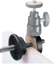
PHOTO CLAMP 296

Diese Klammer kann auf Objekten bis 60mm Dicke befestigt werden. Sie ist mit zwei 3/8" Gewinden ausgerüstet, an denen Kameras oder Stativköpfe montiert werden können.